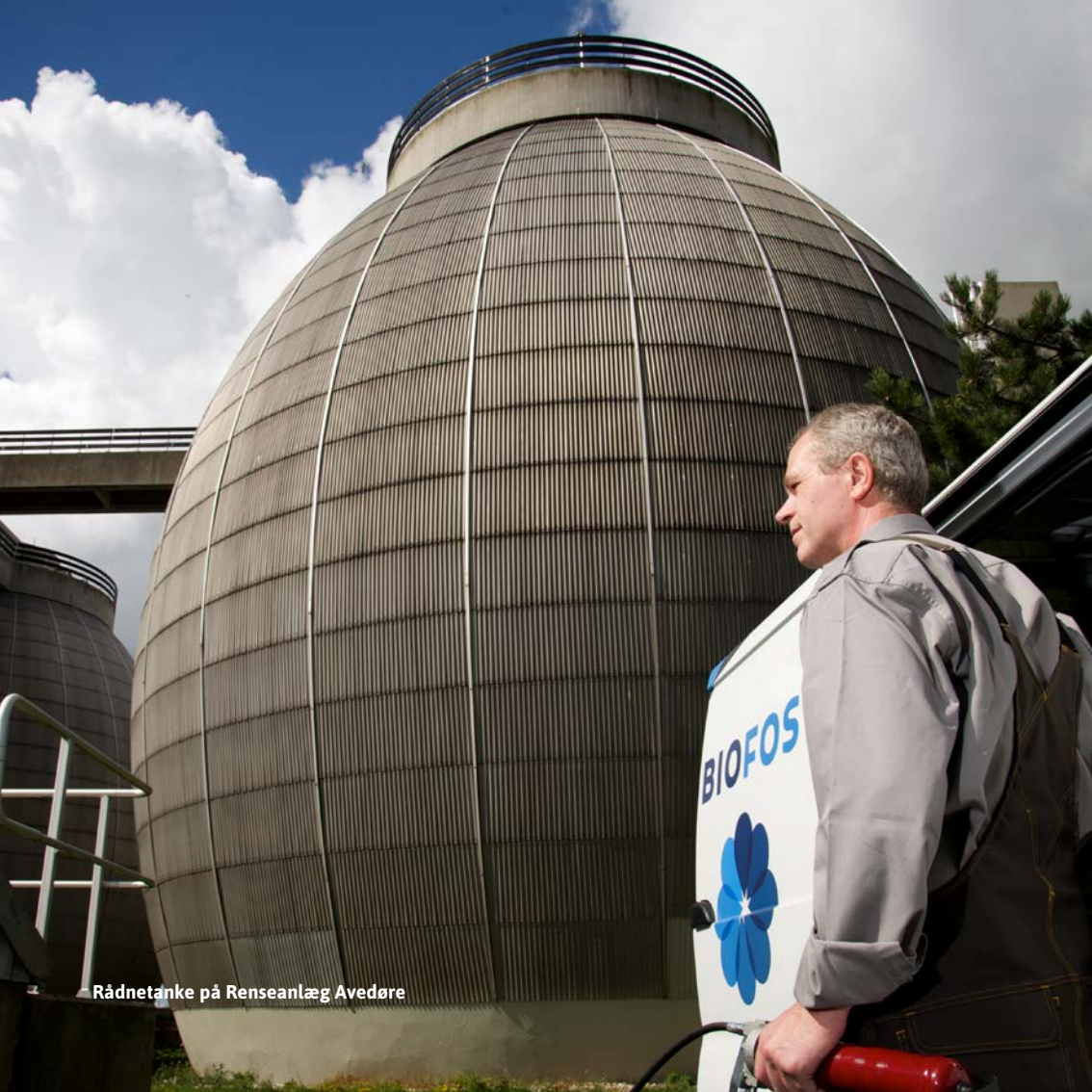
Rådnetanke på Renseanlæg Avedøre